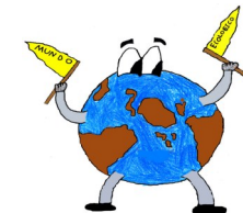
Nuestra mascota, “Don Ecológico”