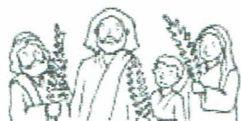
Domingo de Ramos.