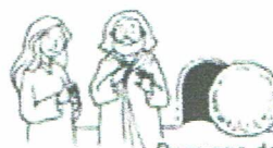
Domingo de Pascua.